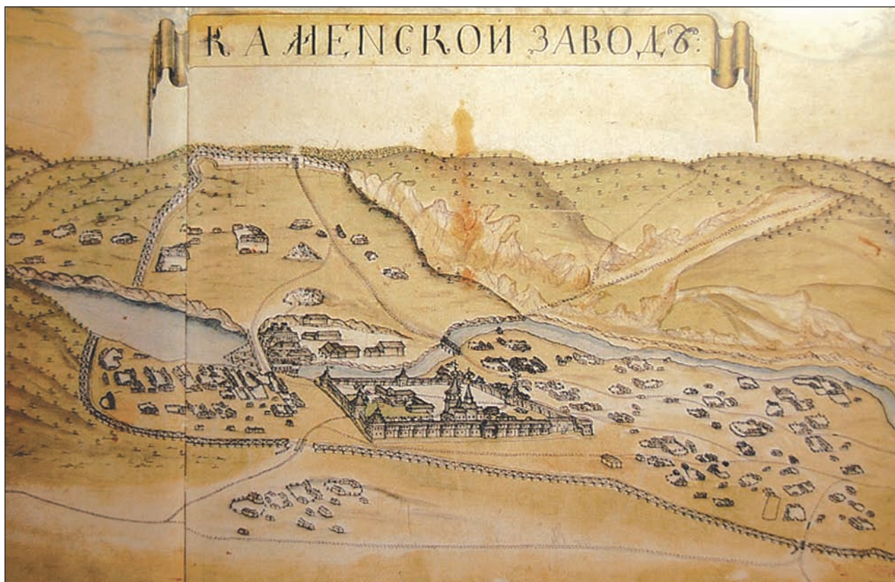
■ Каменский завод. Чертёж из архива Берг-коллегии. XVIII век.

давал серьезное преимущество. Уровень жизни доменного рабочего на Урале был существенно выше, чем его коллег в Олонце и Туле.