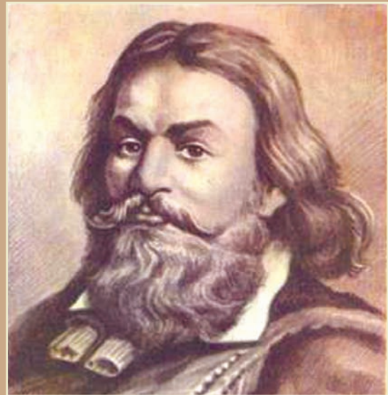
Портрет Винууса по рисунку Л. Гусикова, 1874 г.

1) огромные массивы «пустопорожных» земель, пригодных для промышленной эксплуатации;