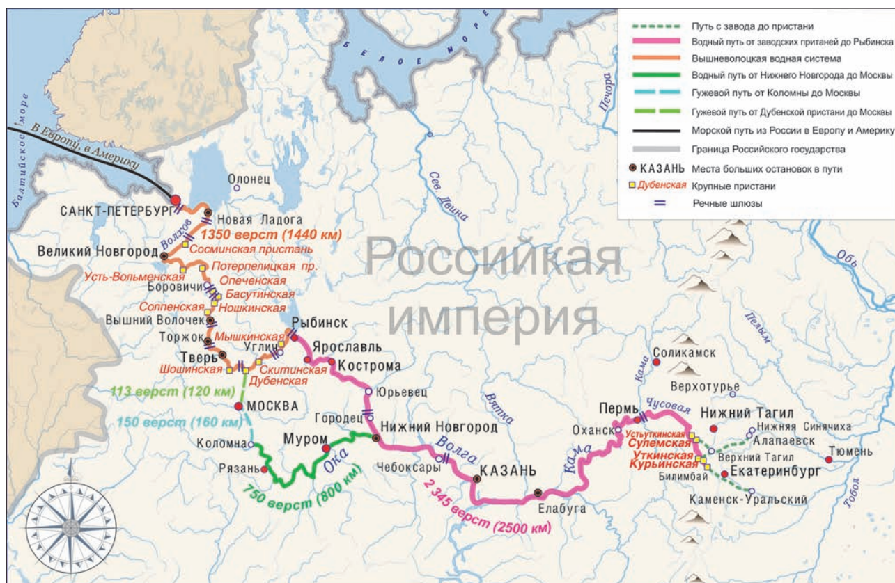
■ Путь железных караванов с Урала до Балтийского моря.

Предложение оказалось очень выгодным. На Урале появилось большое количество частных рудопромышленников, которые сыграли положительную роль в процветании казенных заводов.