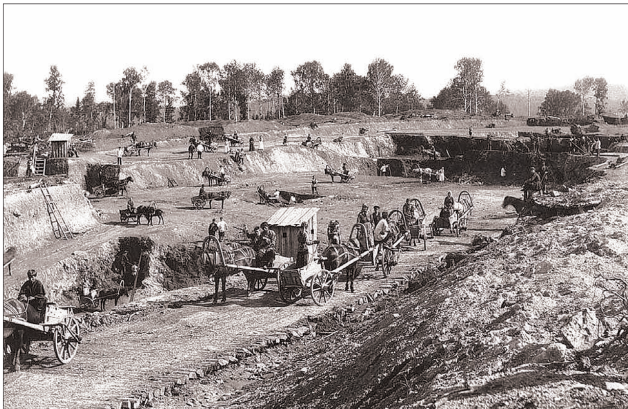
■ Открытая разработка железорудного месторождения в Пермской области. Фото XVIII века.

было намного дешевле английского, и его охотно продавали в Англию вплоть до конца XVIII века. Осуществляя у себя с 70-х годов XVIII века промышленную революцию, Англия крайне нуждалась в привозе необходимого ей для машиностроения железа и ввозила его раза в два больше собственной продукции, причем до 60% в этом привозе составляло русское железо.